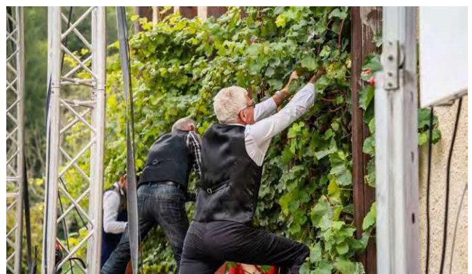
Svečina je poznana po znamenitem srčastem vinogradu, odličnih vinih, gostoljubnih ljudeh in bogatem društvenem življenju.

Praznik je bil preplet pristne domačnosti, razstav lokalnih pridelkov, kulturnih nastopov, predstavitev društev in seveda vinogradniške ponudbe, ki v tem delu Slovenije zaseda prav posebno mesto. Na stojnicah, kjer so obiskovalcem predstavljali svoja vina, so se slišale zgodbe o prehojenih poteh, poskusih in napakah in podpori, ki so jo dobili drug pri drugem.