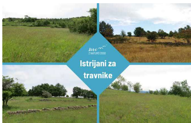
Naslovna fotografija javnega poziva »Istrijani za travnike« - ohranjeni travniki v Slovenski Istri imajo pestro rastlinsko združbo