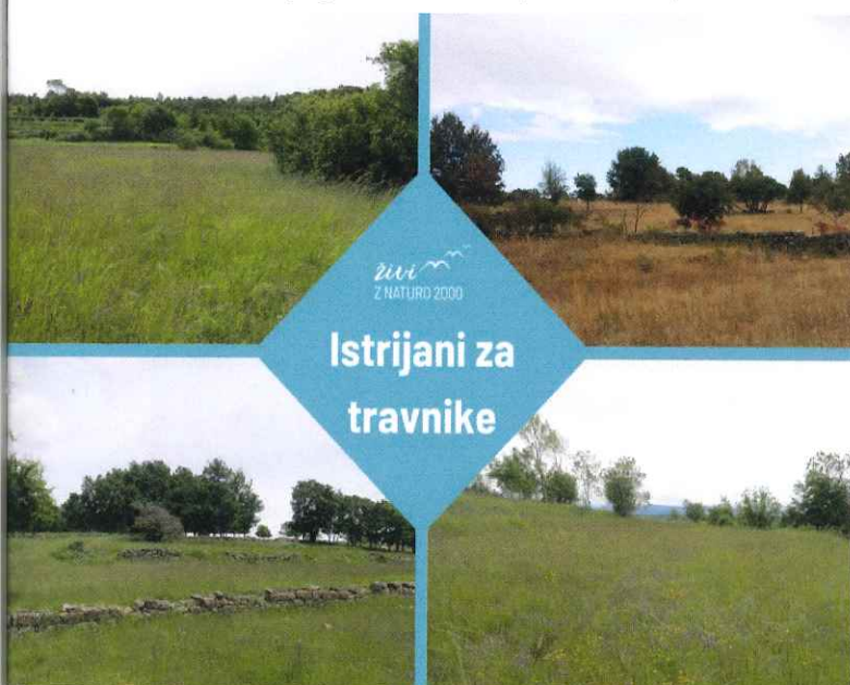
Slika 3: Naslovna fotografija javnega poziva »Istrijani za travnike« - ohranjeni travniki v Slovenski Istri imajo pestro rastlinsko združbo

Javni poziv s prilogami je objavljen na spletnih mestih https://www.kmetijskizavod-ng.si in www.natura2000.si in bo odprt do porabe sredstev oz. do zaključka projekta, 31.12.2025 (zaključek javnega poziva bo objavljen na navedenih spletnih mestih).