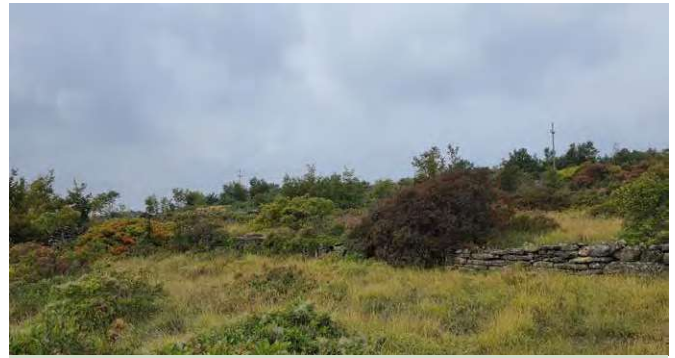
Zaraščanje travnikov