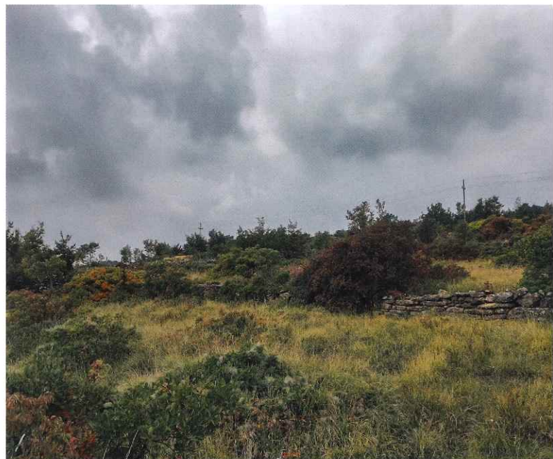
Slika 2: Zaraščanje travnikov; Kmetijstvo tiho ugaša, z izginjanjem travnikov in pašnikov propada tudi del naše tradicije, kulture in lepote naše dežele. Iz Istre odhajajo mladi, s tem odhajajo tudi možnosti za ohranitev obalno-kraškega podeželja.

Partnerji projekta LIFE-IP NATURA.SI smo na podlagi terenskih ogledov ter pogovorov in rešenih anket s kmeti, ki na pilotnem območju vzdržujejo travnike, pripravili aktivnosti za prilagojeno vzdrževanje travnikov, s katerimi želimo spodbuditi ohranjanje travišč in njihove biotske raznovrstnosti.