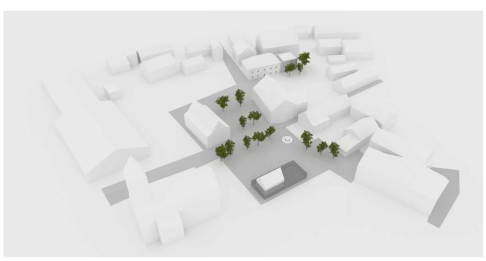
Pogled iz ptičje perspektive

TEMATSKI INTERPRETACIJSKI CENTER NA LOKACIJI V CENTRU IGA V NAVEZAVI Z LOKACIJO NA OBMOČJU MED CESTO IG-ŠKOFLJICA IN IŠČICO