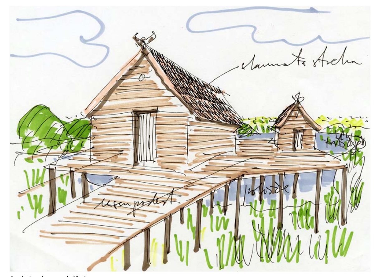
Pogled na leseno ploščad

TEMATSKI INTERPRETACIJSKI CENTER NA LOKACIJI V CENTRU IGA V NAVEZAVI Z LOKACIJO NA OBMOČJU MED CESTO IG-ŠKOFLJICA IN IŠČICO