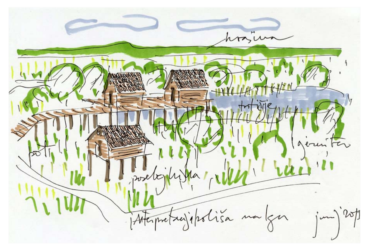
Skica koliščarske naselbine z ojezeritvjo