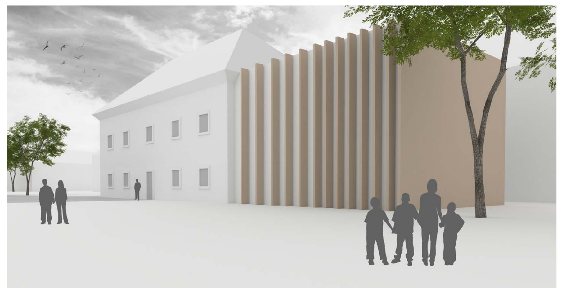
Pogled na objekt iz zadnje strani