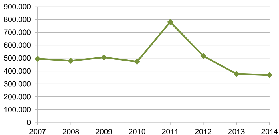
Znanstveno raziskovalno delo v gozdarstvu