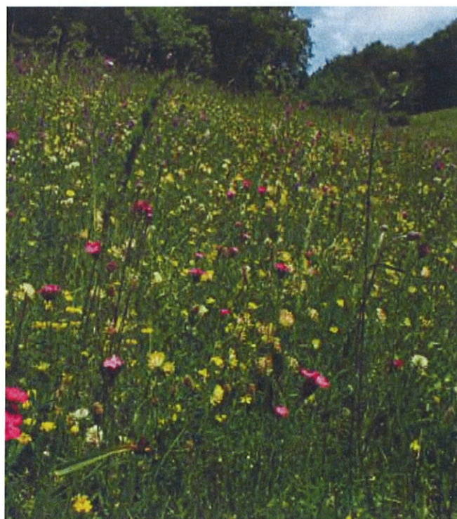
Stanje ohranjenosti nekaterih vrst in habitatnih tipov kmetijske krajine se slabša