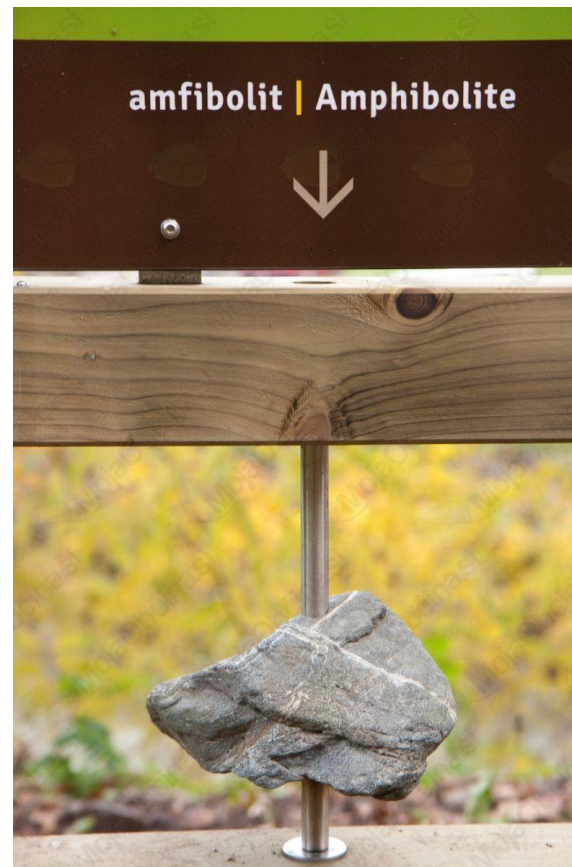
Mesec prostora 2022