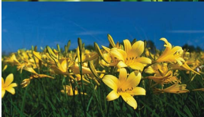
Travniki Goričkega slovijo po barvitosti. Med cvetovi žarijo perunike, kukavice in rumena maslenica.