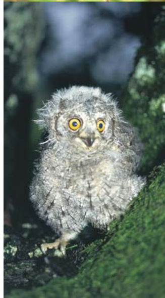
Na Goričkem živi skoraj polovica vseh velikih skovikov v Sloveniji.