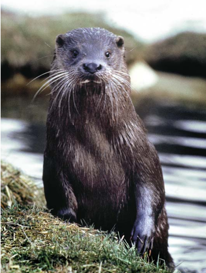
Goričko se ponaša z največjim številom vider na Slovenskem. To je gotovo tudi dokaz, da je tu okolje še zdravo. Želimo si, da tako tudi ostane.

Vidra postaja v evropskem prostoru čedalje bolj redke obvodni prebivalec. Njeno preživetje ogrožamo z onesnaževanjem voda in neprimernim vzdrževanjem površinskih voda in obrežne zarasti.