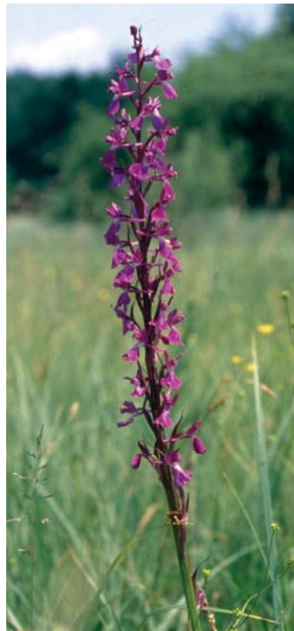
Pisani mokrotni travniki Nerajskih lugov. Junija jih obarvajo vijoličasti cvetovi močvirske kukavice.