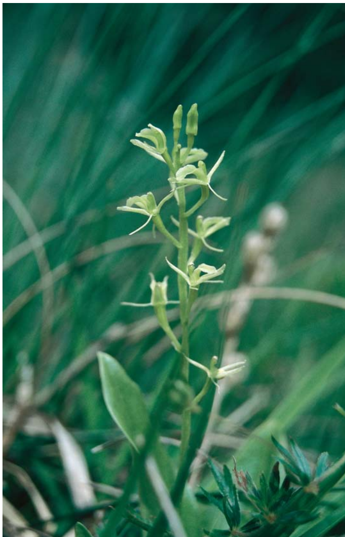
Portret Loeselijeve grezovke, ki jo v naravi le redko vidimo.

raste na močvirnih travnikih in barjih. Pozno spomladi poženeta iz zemlje dva bleščeča zelena lista, za njima pa kakšnih 15 cm visoko stebelce, na katerem poleti zacvetijo zelenkastobeli cvetovi.