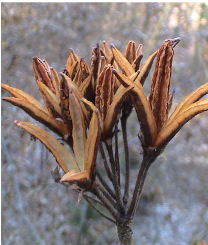
Rumeni sleč je redek, zato ga skušajmo ohraniti. Na sliki so zoreči plodovi.

Rumeni sleč ali azalea, kot to rastlino imenujejo domačini, je listopaden grm, ki zacveti meseca maja z rumenimi in omamno dišečimi cvetovi. Ljubi kislja tla in tople prisojne lege z veliko osončenosti. Raste na gozdnem robu ali v gozdu, v družbi velikih dreves gradna, kostanja in bukve.