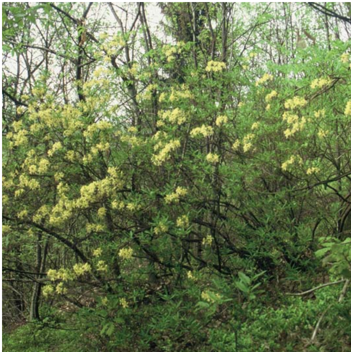
Grmi rumenega sleča potrebujejo dovolj sonca, zato poskrbimo za njihovo osončenost.

Natura 2000 je ekološko omrežje, ki postopoma nastaja v vseh državah Evropske unije. Vanj so vključena območja, ki so pomembna za ohranjanje ogroženih rastlin, živali in njihovih življenjskih okolij.