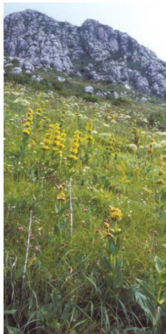
Travišča na Stolu in Planji so prava zakladnica biotske pestrosti saj tu najdemo številne rastlinske in živalske vrste.