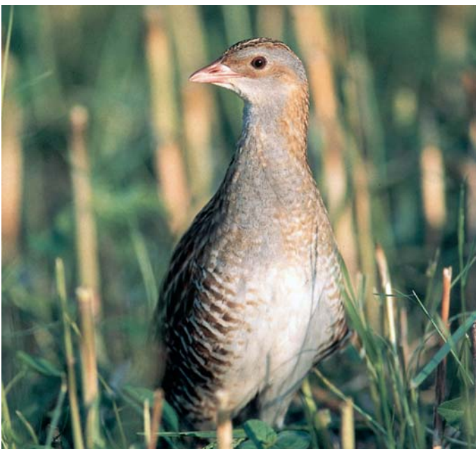
Kosec je svetovno ogrožena vrsta, na travnikih Stola in Planje pa gnezdí kar 50-60 parov.

Kosec večino časa preživi v kritju gostega travniškega rastja. Je prebivalec nižinskih vlažnih travnikov, pa tudi gorskih travišč. Čeprav ni ravno droben - velik je kot grlica - živi tako skrito, da ga človek skoraj nikoli ne vidi. Dosti bolj razpoznavna je koščeva pesem, raskav dvozložen klic krrek-krrek. Klic nekoliko spominja na zvok ob brušenju kose, od tod ime kosec. Prehranjuje se z polži, deževniki, žuželkami, jeseni pa tudi s semeni trav in šašev. Samci s klicanjem privabljajo samice, ki začno gnezditi konec maja. Zimo preživi v tropski Afriki.