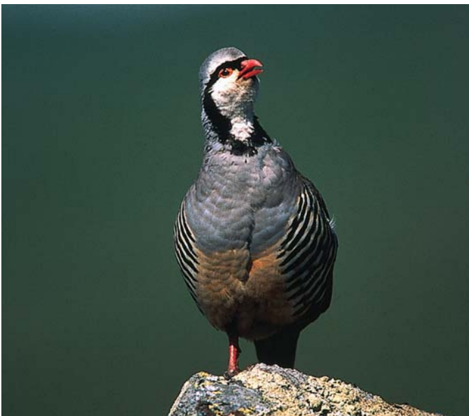
Število kotorn pri nas v zadnjih desetletjih upada predvsem zaradi opuščanja paše in zaraščanja kraških pobočij.

Kotorna najraje prebiva na južnih pobočjih in meliščih, vse tja do višine 2500 metrov. Pozimi si zavetje poišče v nižjih predelih. Velika je kot naš največji divji golob. Ima značilno obarvane boke, ki so prečno temno progasti. Samček se oglašá z značilnim tleskajočim glasom, ki je izrazit predvsem spomladi, ko privablja samice. Prehranjuje se podobno kot kosec. Gnezdí v globelici na tleh v zavetju skal. Zimo preživi v tropski Afriki.