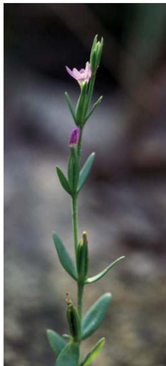
Klasnata tavžentroža uspeva na vlažnih in slanih tleh ob morju.