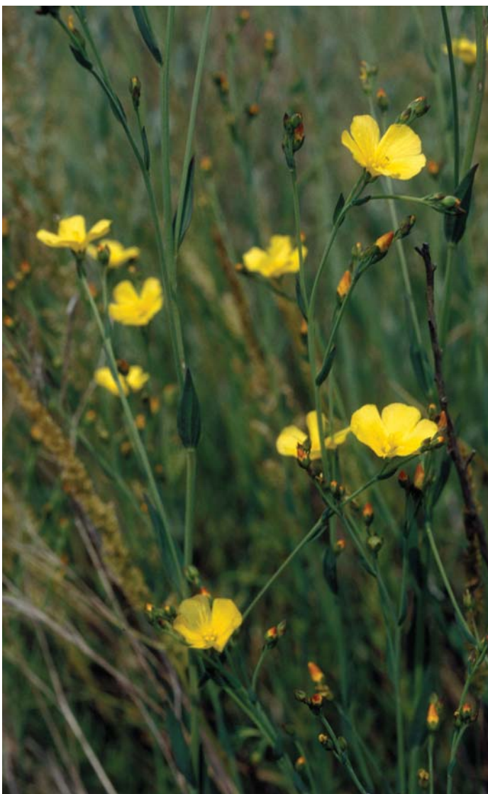
Obmorski lan v slanobjubni družbi.

Do nedavnega sta obe rastlini veljali za izumrli. Kljub temu, da sta se ohranili, sta še vedno ogroženi vrsti.