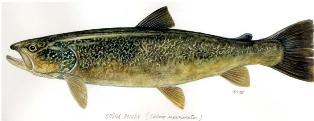
SOŠKA POSTRV (Salmo marmoratus)