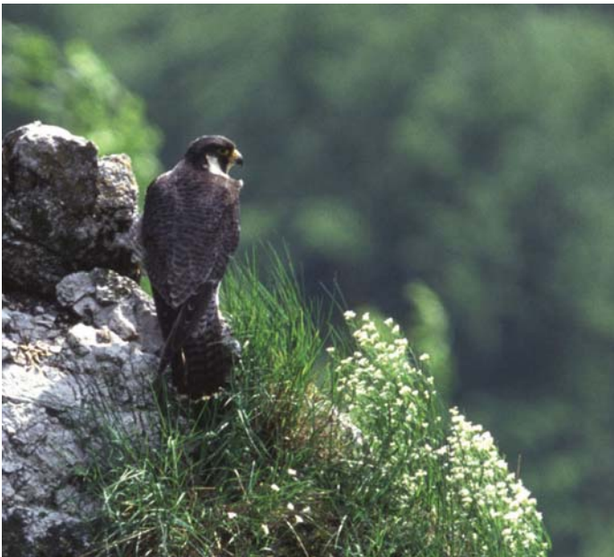
Sokol selec v strmoglavem letu še vedno lovi ptice nad Vipavsko dolino. V ostenjih južnih obronkov Trnovskega gozda in Nanosa najde varna gnezdišča.

Sokol selec je naš največji sokol. Na glavi ima značilno oblikovano liso - brk. Hrani se s pticami velikosti kosa, golobov, vran do galebov in rac. Ptice lovi izključno v zraku v strmoglavem letu, pri čemer lahko doseže 380 km/h. Gnezdi na policah težko dostopnih prepadnih sten. Gnezditni prične zgodaj spomladi ali celo že pozimi. Njihovo število je pred desetletji zaradi uporabe insekticida DDT v Evropi in svetu močno upadlo.