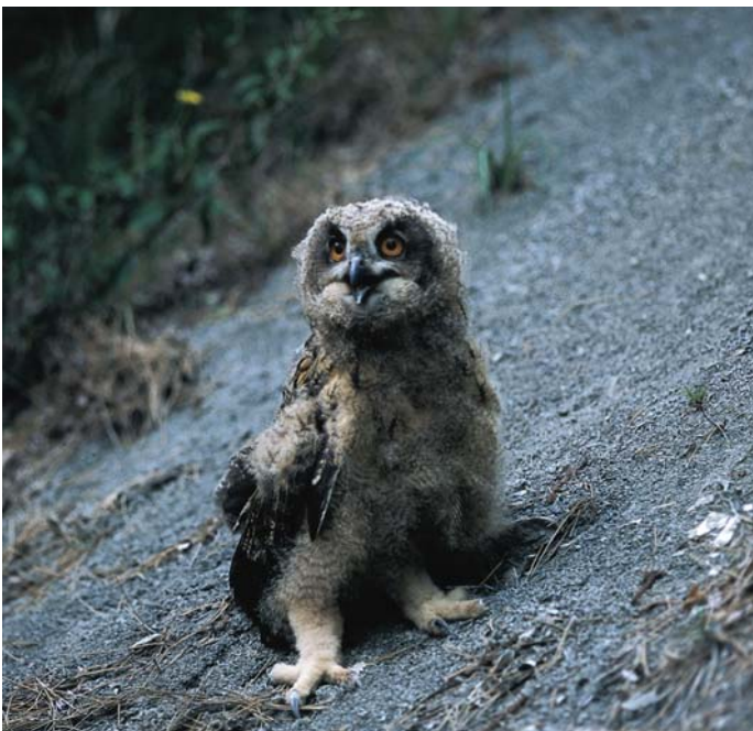
Velika uharica gnezdi v skalnatih stenah južnih obronkov Trnovskega gozda in Nanosa. Ponoči neslišno lovi svoj plen v bližnji Vipavski dolini.

Je največja evropska sova, razpon njenih peruti je kar stošestdeset centimetrov. Samec je veliko manjši od samice. Na glavi ima značilne dolge pernaté čopke - ušesca. Hrani se z majhnimi in srednje velikimi sesalci, na primer polhi, ježi, zajci in kunami, predvsem pa s pticami kot so kos, golobi, šoje, vrane do ptic velikosti kanje in čaplje. Običajno gnezdi na skalnatih policah in votlinah težko dostopnih prepadnih sten. Isti par uporablja isto gnezdišče vrsto let.