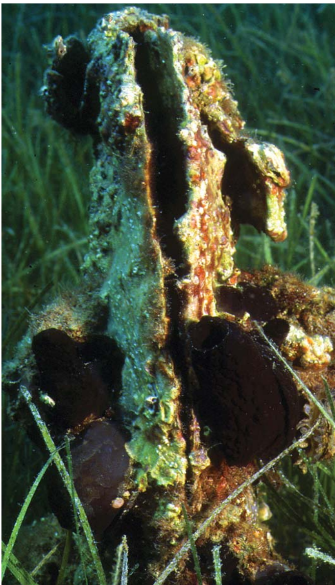
V travniku pozejdonke se skriva leščur, največja školjka na Jadranu. Njegovi lupini sta življenjski prostor številnih rastlin in živali.

Pomembni so, ker proizvajajo kisik in organske snovi, letno kar 20 ton na hektar. So življenjski prostor za veliko število morskih organizmov, vezanih na travnik zaradi prehranjevanja, bivališča, skrivališča ipd. Travniki pozejdonke tudi zmanjšujejo erozijo. S svojim gibanjem močno upočasnijo valovanje in s tem delovanje morja na obrežje.